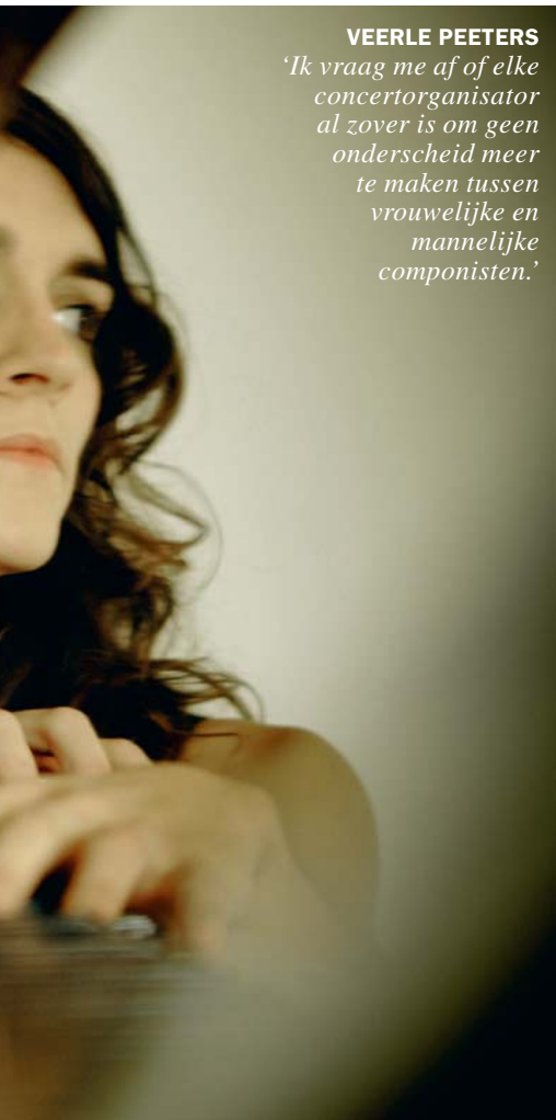
LEEN VAN DEN MEUTER/GF